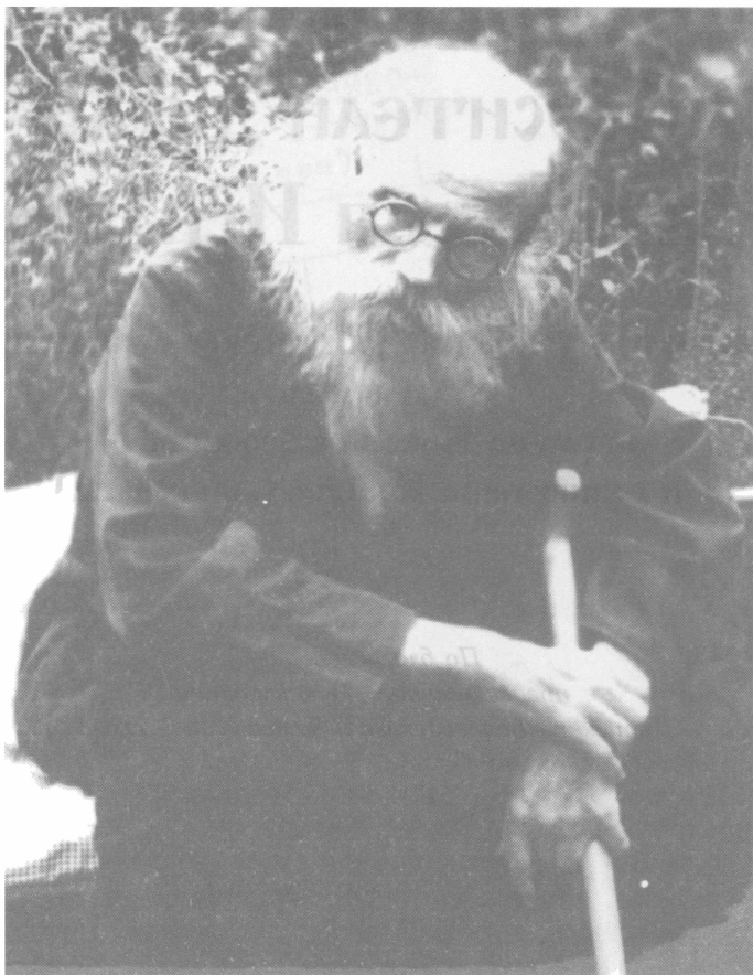
Игумен Никон. 1963 год. Гжатск